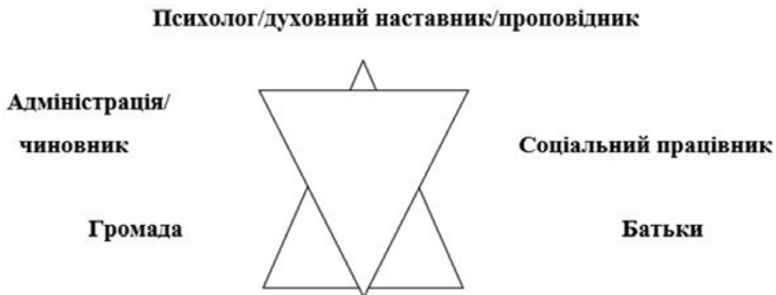
Рис. 5. Структура соціальної єдності

На відміну від наукових праць, письменник описує не лише додаткові факти, які не підлягають цензурі наукових відкриттів, а й містить глибину вірувань та традицій епохи. Науковий погляд учених дозволяє стверджувати, що відчуження, розрив зв'язків між світом батьків і дітей, дефіцит поваги до дитини, її індивідуальності, незахищеність від певних проявів середовища як факт соціального сирітства набув поширення з 50-х років ХХ століття. У науковій літературі використовується термін «соціальний сирота», що пов'язаний з ростом кількості «дітей вулиці». Натомість поет акцентує увагу на духовних причинах: непокорі, прагненню до втілення бажань, відмові від родинних принципів та правил роду як індикаторів поширення сирітства не лише серед дітей, батьків, а й творців