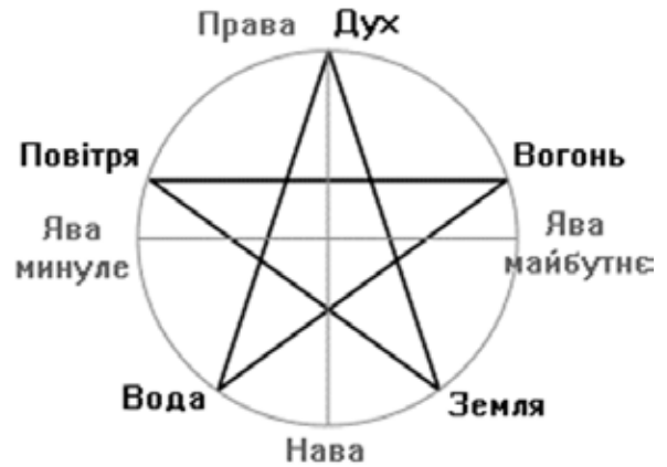
Рис. 4. Пентаграма [21]

становлення християнства значна частина цінностей була видозмінена, що породило низку соціальних викликів, зокрема і духовне зuboжіння, що можна назвати сирітством. Звернення до пентаграми в колі, яке розділяє життя на Наву, Праву, Яву, дозволяє побачити символ людини та принципи духовного розвитку. Звернення у творчості до Божественних законів демонструє глибину розвідок Т. Шевченка у питаннях добробуту населення.