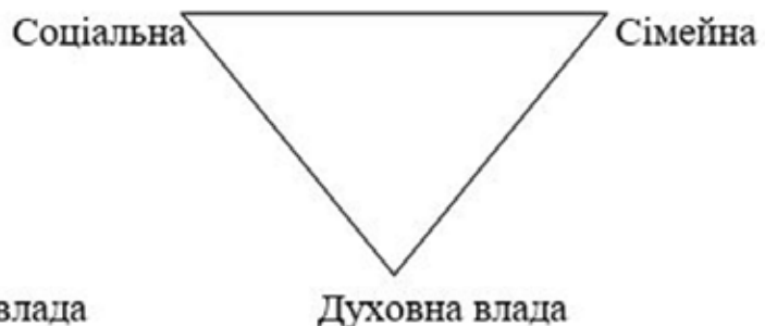
Рис. 2. Символ жіночого впливу