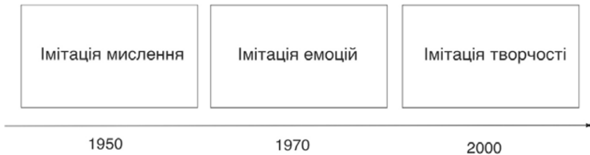
Рис. 1. Хронологія еволюції технологій штучного інтелекту у контексті соціально-психологічної парадигми

Найголовнішим, на нашу думку, атрибутом людського мислення є здатність до усвідомлення «абсурду» як результату існування парадоксів логіки. Будь-який результат для машини є результатом дії логічно зумовленого алгоритму, тому якщо алгоритм відбувся (операцію виконано), то цей результат не може містити логічної суперечності. Основою людського мислення є пошук суперечностей та природне прагнення до генерації абсурду, який на всіх етапах суспільної еволюції відігравав вирішальне значення науково-технічного, культурного та суспільного прогресу. У цьому плані здатність розуміти гумор у будь-якій його формі є швидким, але дуже дієвим способом ідентифікації людини в інформаційному просторі. Деякі прийоми на основі розуміння «абсурдів» уже використовуються