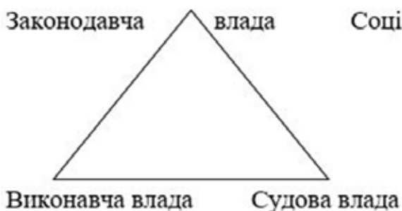
Рис. 1. Символ чоловічого впливу

У поезії Т. Шевченка [24; 25; 26] поклоніння Воді, Землі, вплив сили Повітря та сакральне очищення Вогнем прослідковується майже у кожному творі («Тризна. Посвята», «Сова», «Дівичії ночі», «Єретик», «Великий льох», «Наймичка», «І мертвим, і живим, і ненародженим...», «Заповіт», «Думка» та ін.) [25], як і причинно-наслідкові зв'язки у долі людини. Варто зазначити, що в процесі