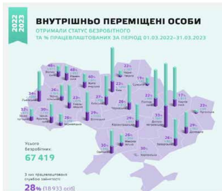
Рис. 1. Статистика працевлаштування серед ВПО, 2022–2023 рр.

А. Путінцев і Ю. Пащенко зазначають: «Найчисельнішою у світі групою соціально незахищених осіб вважається група людей, яка переміщується всередині країни, – переселенці» [12]. Основними проблемами, з якими стикаються ВПО, є висока орендна плата за житло, незадовільні умови проживання в тимчасовому житлі (особливо для сімей із дітьми й осіб з інвалідністю), а також нестача тимчасового та соціального житла у громаді. Для розв'язання цієї проблеми необхідне виділення додаткових коштів із бюджету та координація органів державної влади